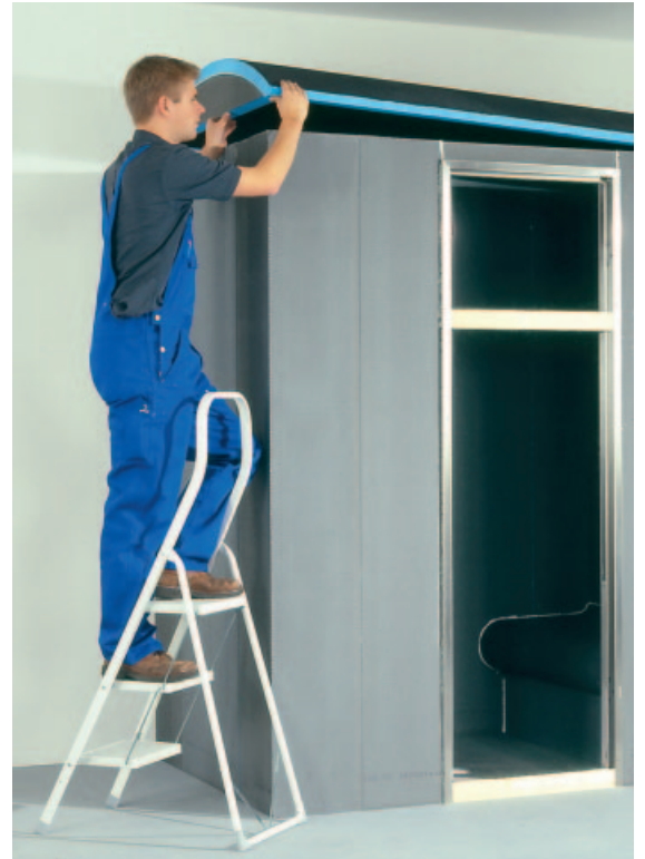
Die Dachsegmente unter Zuhilfenahme des mitgelieferten Klebers satt und ohne Kleber-Steg-Unterbrechungen auf die Wände kleben.