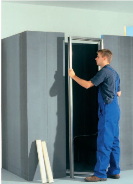
Bei Verwendung von Edelstahltürzargen wird das Element vor dem Aufsetzen des Daches montiert. Zargenlose Duschtüren werden nach der Verfliesung montiert.